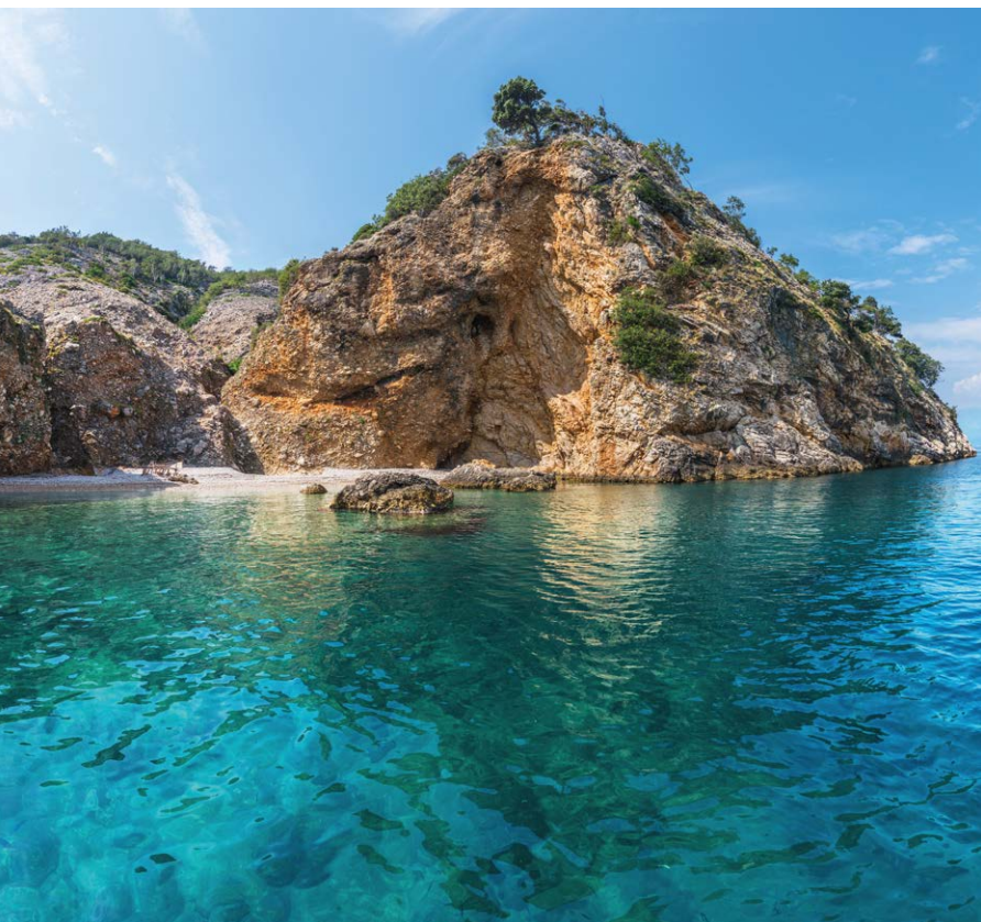
▲ Skalistą zatoczką na Cresie